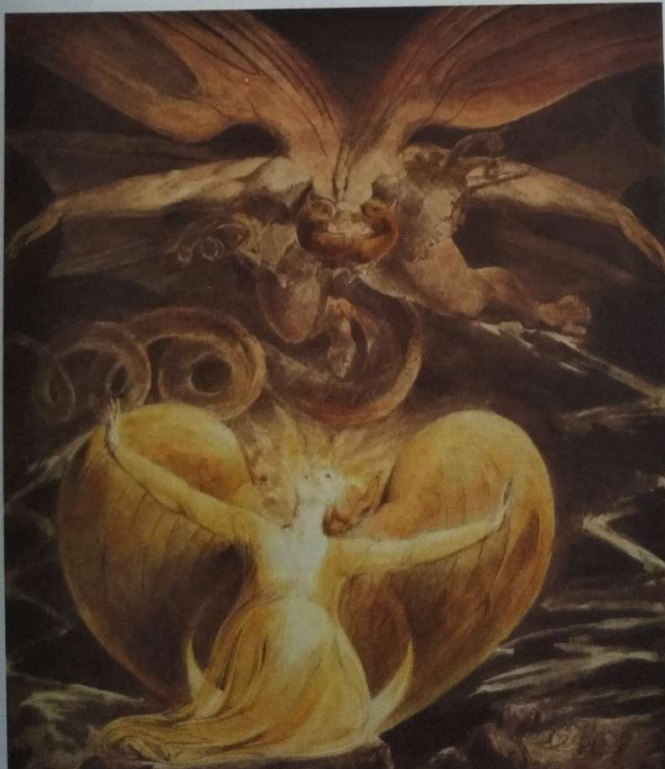
William Blake [czyt.: tyliam blejk] Wielki czerwony smok i niewiasta wzrost w słońcu, 1810

Zapamiętaj! Antonimy są stosowane w celu wydobycia kontrastów myślowych i uczuciowych.